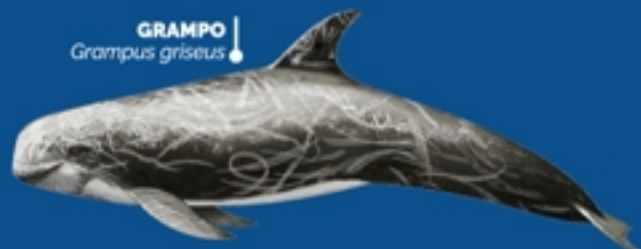
GRAMPO Grampus griseus

QUESTO SEMPRE E SOLO NEL RISPETTO DELLE REGOLE DI AVVICINAMENTO