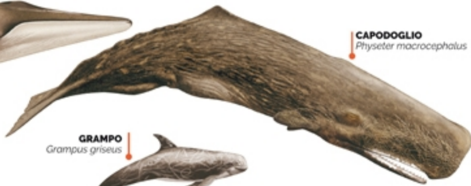
GRAMPO Grampus griseus