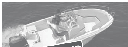
Cap Camarat 4.7 CC