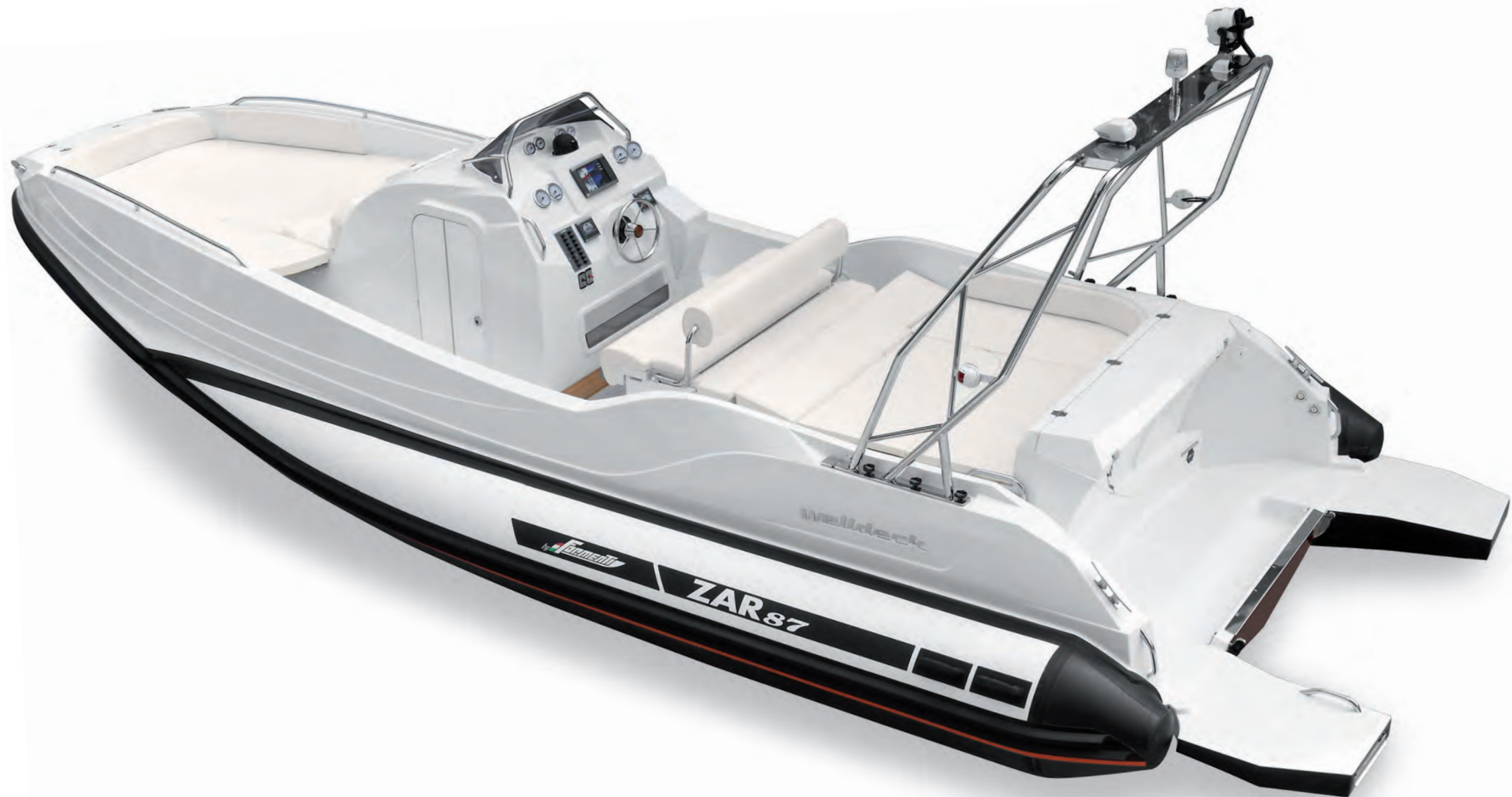
ZAR 87 welldeck